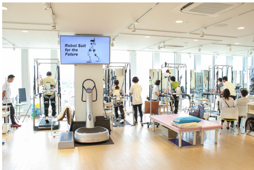
「Neuro HALFIT」のイメージ (湘南ロボケアセンター)

当社は、より多くの方々がロボケアセンターにアクセスしやすくなるよう、今後も事業拡大を進めることで、障がい者の方や、高齢者の方が能動的に社会活動に参画し続けられるような社会の形成を目指していきます。