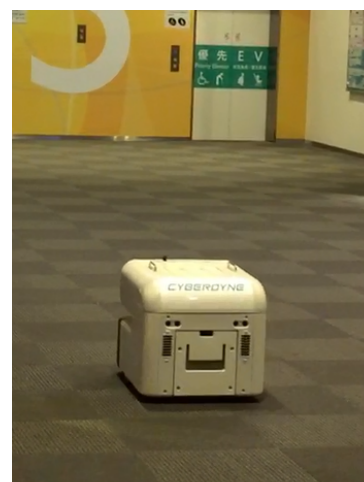
（デモンストレーションのイメージ）

ご注意： ● 施設オープン前の開催となりますため、通常の入出口は使用できないため、後述の「メディア受付」の場所をご確認ください。