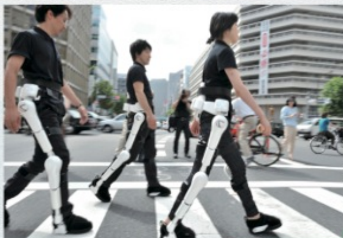
ロボットスーツ HAL® のデモ歩行